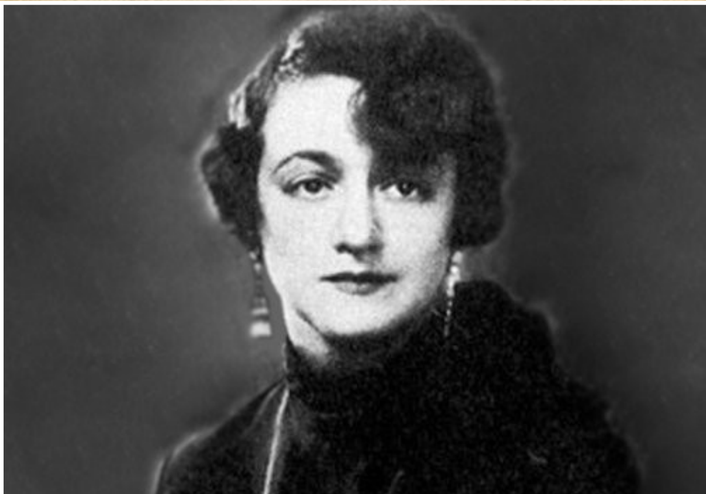
Елена Сергеевна - третья жена Михаила Афанасьевича, хранительница его литературного наследия. Основной прототип Маргариты в романе «Мастер и Маргарита»

На свете существует только две силы: доллары и литература. «Зойкина квартира»